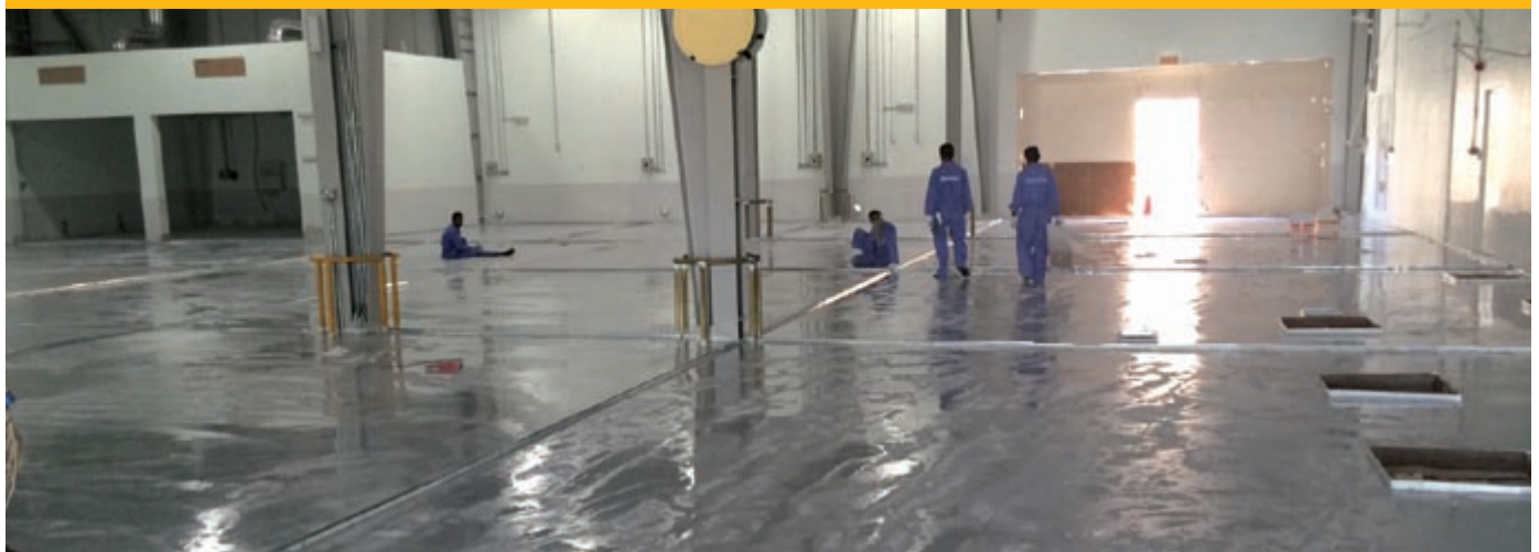
Recubrimiento Aplicado en el taller de vehículos